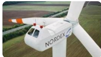
Generation Alpha N80/2500

22 Jahre mit mehr als 24,8 GW im Betrieb + 13,7 GW Auftragseingang*