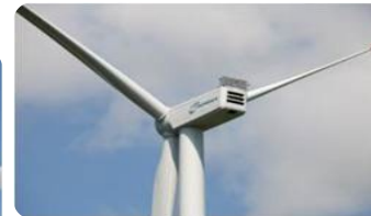
Generation Delta N100/3300 N117/3000 N117/3675 N131/3000 N131/3300 N131/3600 N131/3900