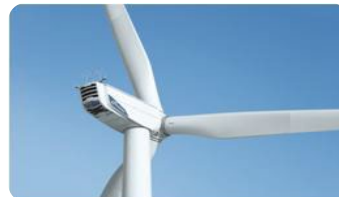
Generation Gamma N80/2500 N90/2500 N100/2500 N117/2400