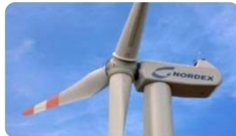
Generation Beta N90/2500